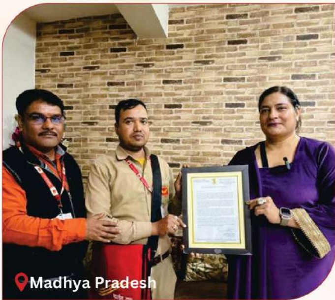
📍 Madhya Pradesh