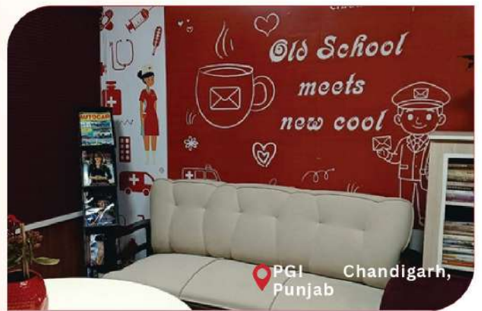
PGI Chandigarh, Punjab