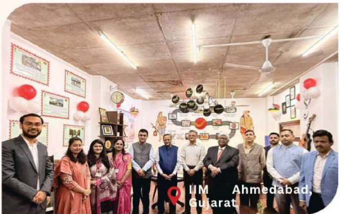
IIM Ahmedabad, Gujarat