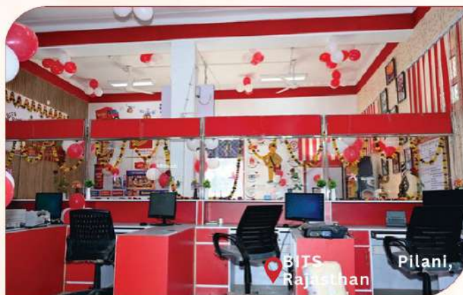
BITS Pilani, Rajasthan