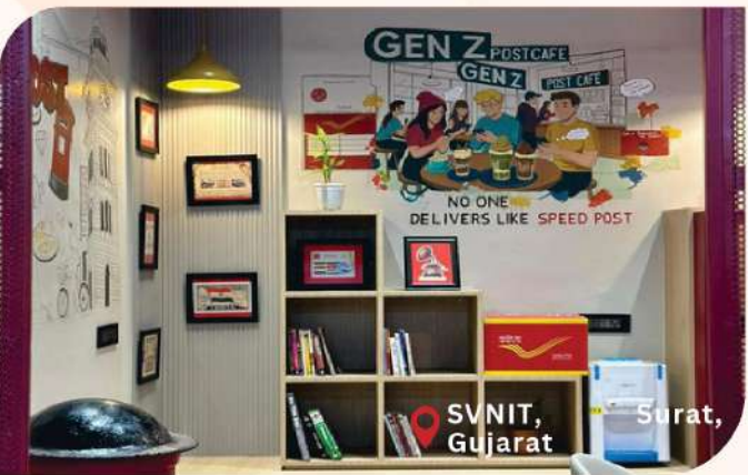
SVNIT, Surat, Gujarat