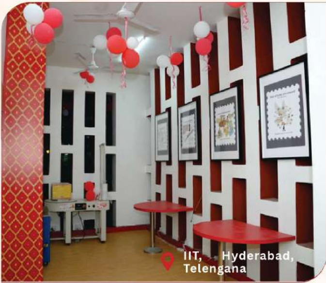
IIT, Hyderabad, Telangana

ଭାରତୀୟ ଡାକ ଏନ-ଜେନ ପୋଷ୍ଟ ଅଫିସଗୁଡ଼ିକର ବିସ୍ତାର ସହିତ ଏହାର ଆଧୁନିକୀକରଣ ଅଭିଯାନ ଜାରି ରଖିଛି, ପାରମ୍ପରିକ ପୋଷ୍ଟାଳ ସ୍ଥାନଗୁଡ଼ିକୁ ସମସାମୟିକ, ଯୁବ କେନ୍ଦ୍ରିକ ଏବଂ ନାଗରିକ ଅନୁକୂଳ ସେବା କେନ୍ଦ୍ରରେ ପରିଣତ କରିଛି । IIT ହାଇଦ୍ରାବାଦ, IIM ଅହମ୍ମଦାବାଦ, SVNIT ସୁରତ, IIT ମାଡ୍ରାସ, ପୁଣେ ବିଶ୍ୱବିଦ୍ୟାଳୟ ଏବଂ କାଶ୍ମୀର ବିଶ୍ୱବିଦ୍ୟାଳୟ ସମେତ ପ୍ରମୁଖ ଶିକ୍ଷାନୁଷ୍ଠାନଗୁଡ଼ିକରେ ମୋଟ 45ଟି N-Gen ପୋଷ୍ଟ ଅଫିସ୍ ଉଦଘାଟନ କରାଯାଇଛି । ଏଥିମଧ୍ୟରୁ 11ଟି କେବଳ ଜାନୁଆରୀ 2026 ରେ ଉଦଘାଟନ କରାଯାଇଥିଲା । ବିଦ୍ୟାର୍ଥୀଙ୍କ ସକ୍ରିୟ ଅଂଶଗ୍ରହଣରେ ଡିଜାଇନ୍ ହୋଇଥିବା ଏହି ପୋଷ୍ଟ ଅଫିସଗୁଡ଼ିକରେ ଆଧୁନିକ ଆଭ୍ୟନ୍ତରୀଣ ସାଜସଜ୍ଜା, ଡିଜିଟାଲ୍ ସେବା, ମାଗଣା ୱାଇ-ଫାଇ ଏବଂ ସୂଜନଶୀଳ ସ୍ଥାନ ରହିଛି , ଯାହା ଭାରତୀୟ ଡାକ ର ପୁରୁଣା ବିଶ୍ୱାସର ଐତିହ୍ୟକୁ ନୂତନ ଯୁଗର ନବସୃଜନ ସହିତ ମିଶ୍ରଣ କରିଥାଏ , ଯୁବ ଉପଭୋକ୍ତାଙ୍କ ସହିତ ଭାରତୀୟ ଡାକ ର ସଂଯୋଗକୁ ମଜବୁତ କରିଥାଏ ।