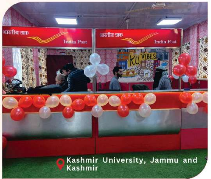
Kashmir University, Jammu and Kashmir