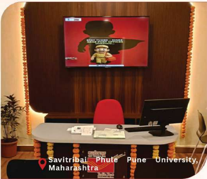
Savitribai Phule Pune University, Maharashtra