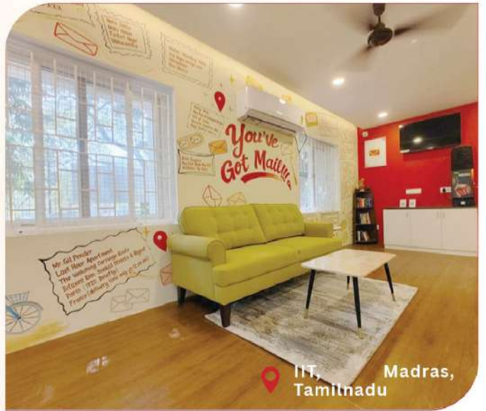
IIT, Madras, Tamilnadu