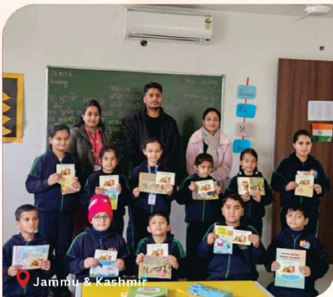
Jammu & Kashmir