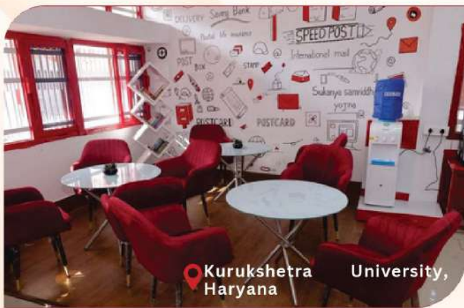
Kurukshetra University, Haryana