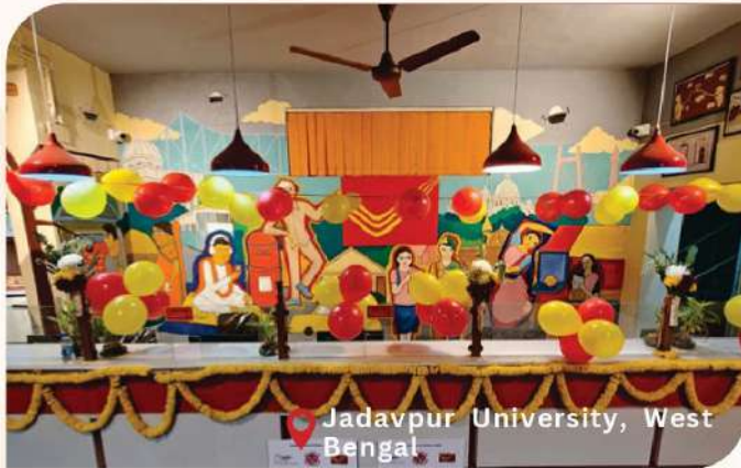
Jadavpur University, West Bengal