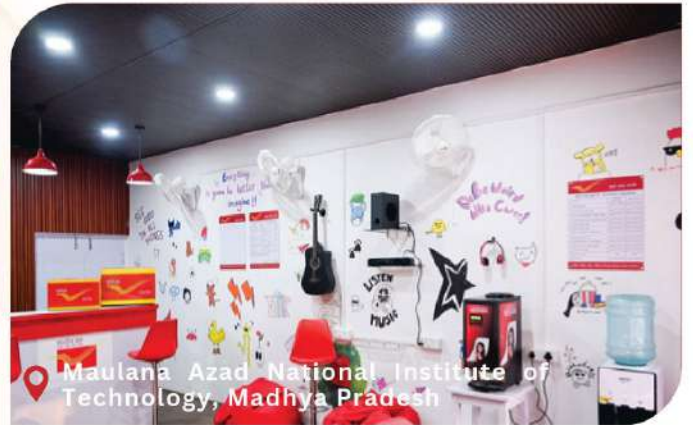
Maulana Azad National Institute of Technology, Madhya Pradesh