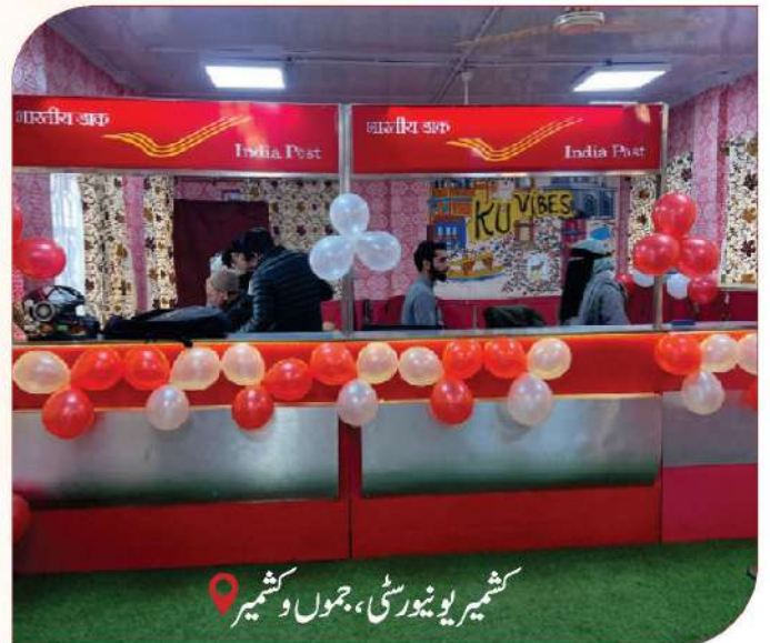
کشمیر یونیورسٹی، جموں و کشمیر