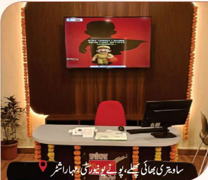
ساویتری بھائی پھلے، پونے یونیورسٹی، مہاراشٹر