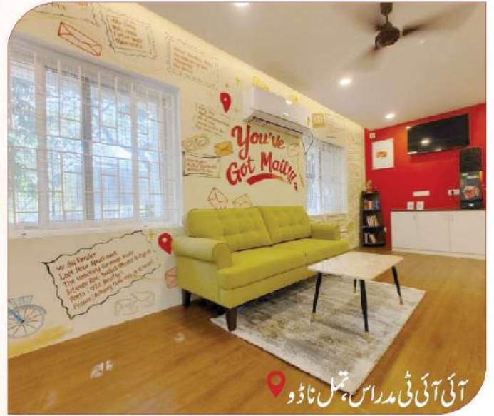
آئی آئی ٹی مدراس، تمل ناڈو