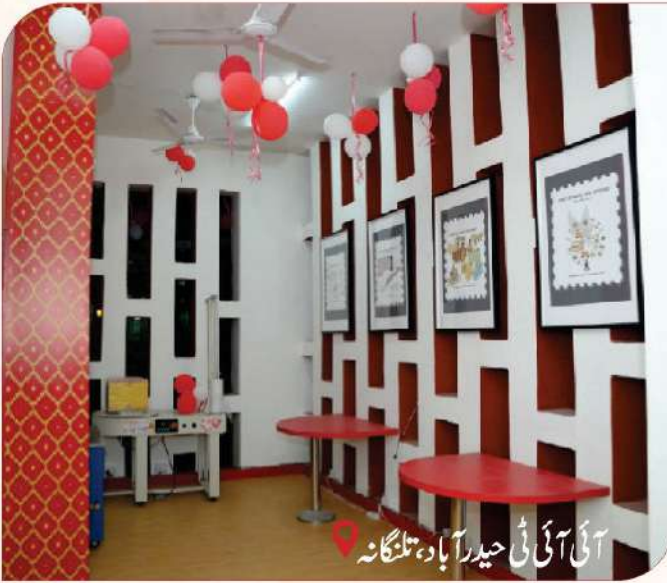
آئی آئی ٹی حیدرآباد، تلنگانہ

طلباء کی فعال شرکت کے ساتھ ڈیزائن کئے گئے، یہ پوسٹ آفسز جدید انٹیریورز، ڈیجیٹل سروسز، مفت وائی فائی، اور تخلیقی جگہیں پیش کرتے ہیں، جو انڈیا پوسٹ کے اعتماد کی پرانی وراثت کو نئے دور کی اختراع کے ساتھ ملاتے ہیں، انڈیا پوسٹ کے نوجوان صارفین کے ساتھ رابطے کو مضبوط بناتے ہیں۔