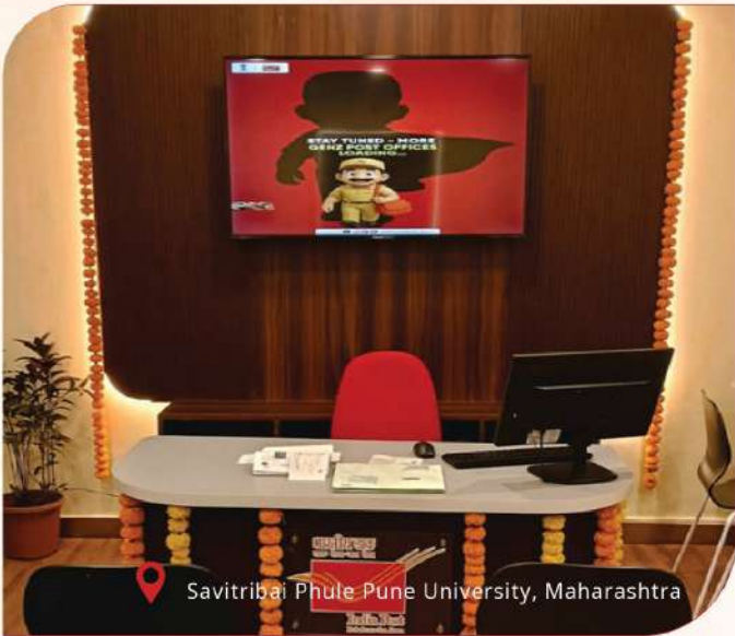
Savitribai Phule Pune University, Maharashtra