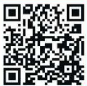
വീഡിയോ കാണാൻ ഈ ക്യാന്റർ കോഡ് സ്കാൻ ചെയ്യുക

"ഭാരത് സമ്പർക്ക് - ഇന്ത്യയുടെ യുവ മനസ്സുകളെ ആകർഷിക്കുന്നു" എന്ന ഔദ്യോഗിക സംരംഭത്തിന്റെ ഭാഗമായി ബഹുമാനപ്പെട്ട കേന്ദ്ര വാർത്താവിനിമയ, വടക്കുകിഴക്കൻ മേഖല വികസന മന്ത്രി ശ്രീ ജ്യോതിരാദിത്യ എം. സിന്ധ്യ ഇന്ത്യൻ ഇൻസ്റ്റിറ്റ്യൂട്ട് ഓഫ് ടെക്നോളജി ഡൽഹി കാമ്പസ് സന്ദർശിക്കുകയും വിദ്യാർത്ഥികളുമായി ഒരു സംവേദനാത്മക സെഷൻ നടത്തുകയും ചെയ്തു.