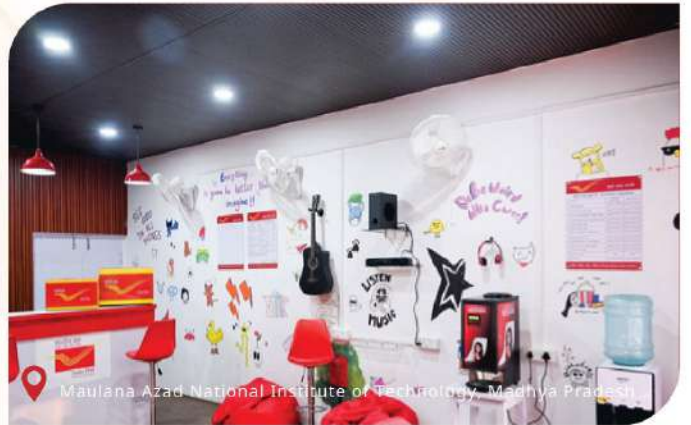
Maulana Azad National Institute of Technology, Madhya Pradesh