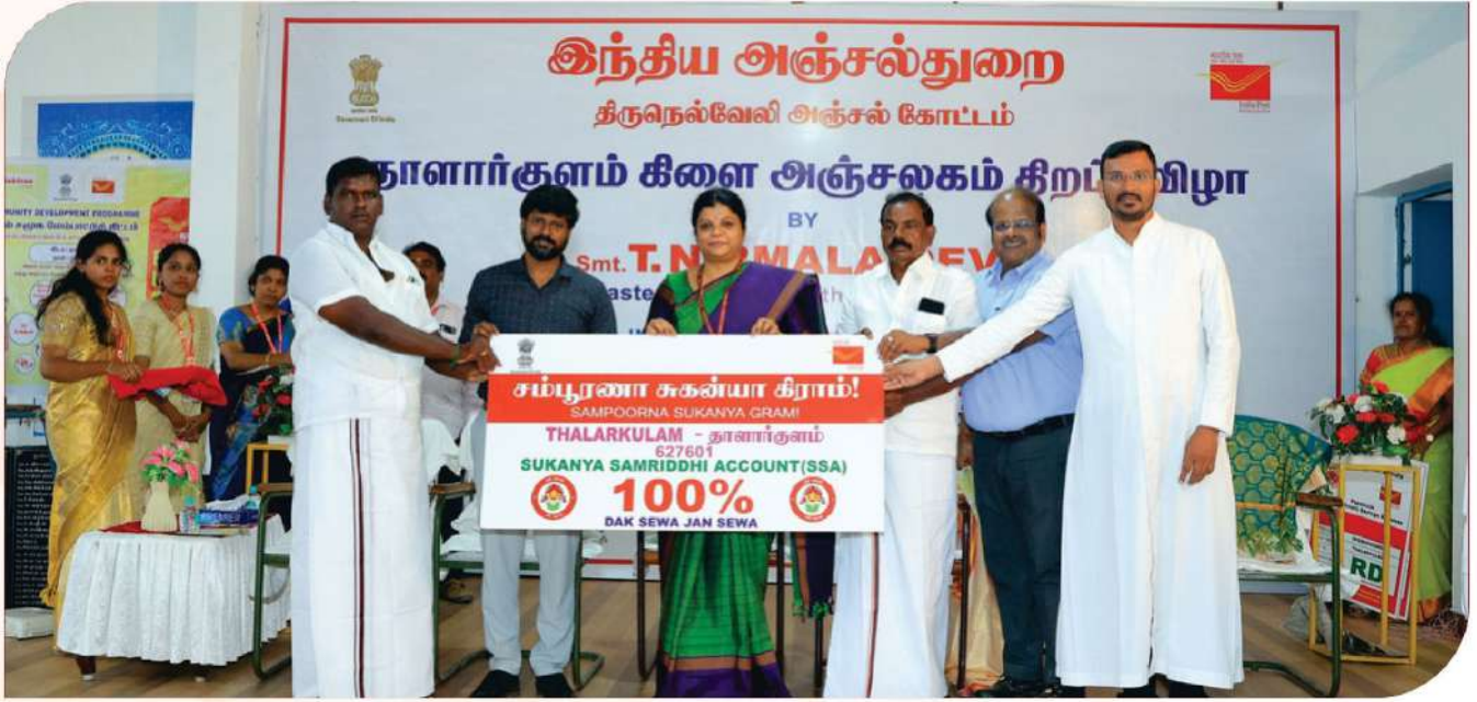
ഗ്രാമീണരുടെ സജീവ പങ്കാളിത്തത്തോടെ, സമ്പൂർണ്ണ ഇൻഷുറൻസും സമ്പാദ്യ പരിരക്ഷയും നേടുന്നതിൽ കൂട്ടായ വിശ്വാസവും സഹകരണവും പ്രതിഫലിപ്പിക്കുന്ന തരത്തിൽ തലാർക്കുളത്തെ സമ്പൂർണ്ണ ബീമ ഗ്രാമമായും സമ്പൂർണ്ണ സുകന്യ സമ്പാദ്യ ഗ്രാമമായും പ്രഖ്യാപിച്ചു.