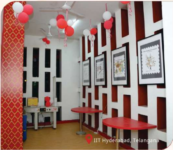
IIT Hyderabad, Telangana

ഭാരതീയ തപാലിന്റെ വിശ്വാസ പാരമ്പര്യത്തെ പുതിയ കാലത്തെ നവീകരണവുമായി സംയോജിപ്പിച്ച് യുവ ഉപയോക്താക്കളുമായുള്ള ഭാരതീയ തപാലിന്റെ ബന്ധം ശക്തിപ്പെടുത്തിക്കൊണ്ട് വിദ്യാർത്ഥികളുടെ സജീവ പങ്കാളിത്തത്തോടെ രൂപകൽപ്പന ചെയ്ത ഈ പോസ്റ്റ് ഓഫീസുകളിൽ ആധുനിക ഇന്റീരിയറുകൾ, ഡിജിറ്റൽ സേവനങ്ങൾ, സൗജന്യ വൈ-ഫൈ, ക്രിയേറ്റീവ് ഇടങ്ങൾ എന്നിവ ഉൾപ്പെടുന്നു.