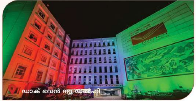
ഡാക് ഭവൻ ന്യൂ ഡൽഹി