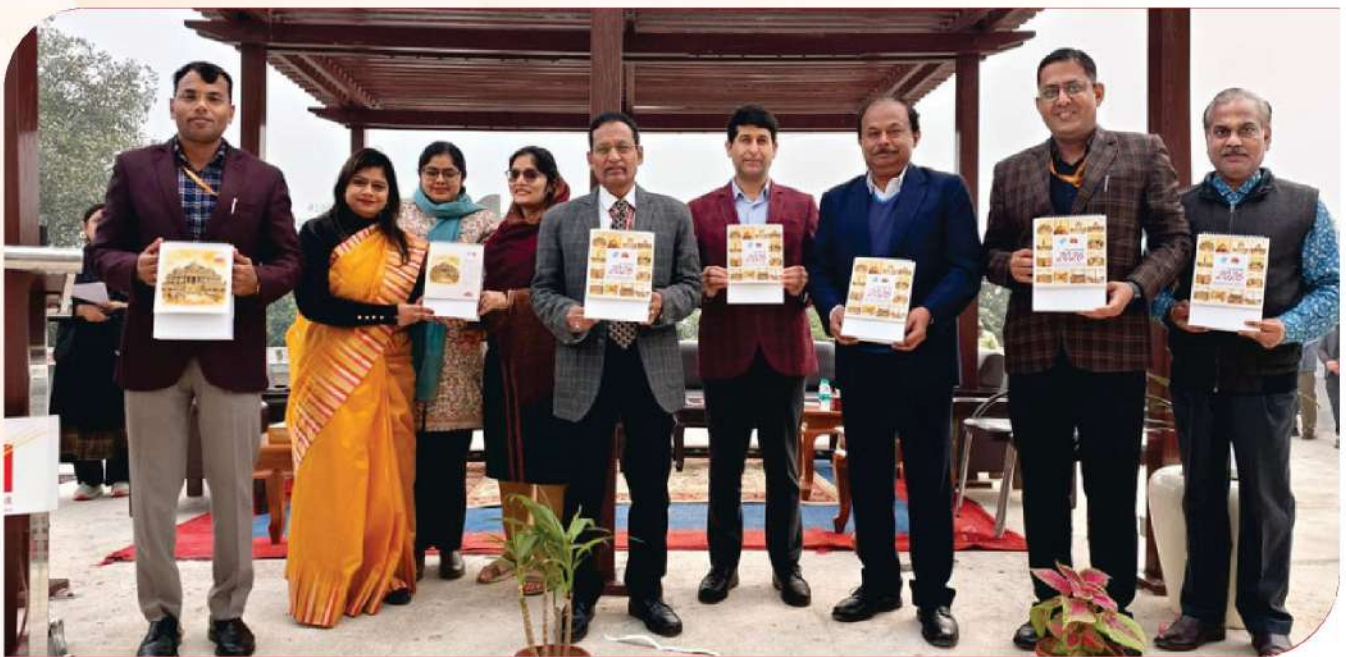
2026 ലെ പുതുവത്സരാഘോഷത്തോടനുബന്ധിച്ചു ഡൽഹിയിലെ ചരിത്ര സ്മാരകങ്ങളുടെ തപാൽ സ്റ്റാമ്പുകൾ ചിത്രീകരിച്ച 2026 ലെ ഫിലാറ്റലിക് ഡെസ്ക് കലണ്ടർ ഡൽഹി സർക്കിൾ ചീഫ് പോസ്റ്റ് മാസ്റ്റർ ജനറൽ കേണൽ അഖിലേഷ് കുമാർ പാണ്ടെ പുറത്തിറക്കി.