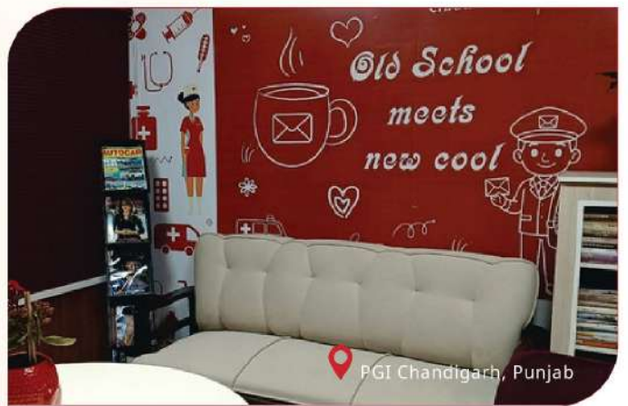
PGI Chandigarh, Punjab