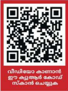
വീഡിയോ കാണാൻ ഈ ക്യാന്റർ കോഡ് സ്കാൻ ചെയ്യുക

വാർത്താവിനിമയ, ഗ്രാമവികസന സഹമന്ത്രി ഡോ. ചന്ദ്രശേഖർ പെമ്മസാനി ഭാരതീയ തപാൽ കുടുംബത്തിന് ഊഷ്മളമായ പുതുവത്സരാശംസകൾ നേർന്നു. കഴിഞ്ഞ വർഷത്തെ അനുസ്മരിച്ചുകൊണ്ട്, കണക്റ്റിവിറ്റി ശക്തിപ്പെടുത്തുന്നതിലും, പൗരന്മാർക്ക് സേവനങ്ങളിലേക്കുള്ള പ്രവേശനം വിപുലീകരിക്കുന്നതിലും, പൊതുജനവിശ്വാസം ശക്തിപ്പെടുത്തുന്നതിലും തപാൽ ജീവനക്കാരുടെ സമർപ്പണത്തെയും കൂട്ടായ ശ്രമങ്ങളെയും അദ്ദേഹം പ്രശംസിച്ചു.