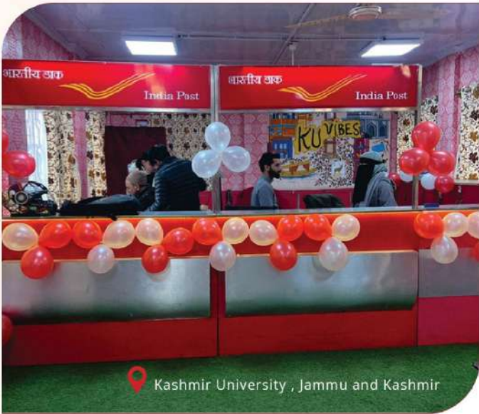
Kashmir University, Jammu and Kashmir