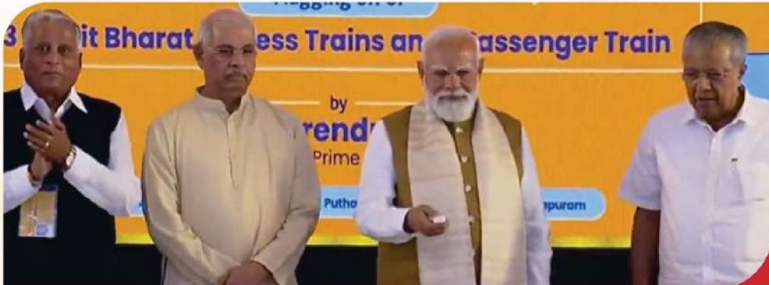
ബഹുമാനപ്പെട്ട പ്രധാനമന്ത്രി പൂജപ്പുര ഹെഡ് പോസ്റ്റ് ഓഫീസ് മന്ദിരം ഉദ്ഘാടനം ചെയ്യുന്നു

ഭാരതത്തിന്റെ ബഹുമാന്യനായ പ്രധാനമന്ത്രി ശ്രീ നരേന്ദ്ര മോദി 2026 ജനുവരി 23-ന് കേരളത്തിലെ തിരുവനന്തപുരത്ത് അത്യാധുനിക സൗകര്യങ്ങളോടു കൂടി നിർമ്മിച്ച പൂജപ്പുര ഹെഡ് പോസ്റ്റ് ഓഫീസ് മന്ദിരം ഉദ്ഘാടനം ചെയ്തു. നവീകരിച്ച അടിസ്ഥാന സൗകര്യങ്ങൾ, മെച്ചപ്പെട്ട ഡിജിറ്റൽ കണക്റ്റിവിറ്റി, പൊതുജനങ്ങൾക്ക് വിപുലമായ സേവന വിതരണം എന്നിവയുൾപ്പെടെ പൂർ കേന്ദ്രീകൃത സേവനങ്ങൾക്കായുള്ള ഇന്ത്യാ പോസ്റ്റിന്റെ വീക്ഷണത്തെ ഈ അധുനിക സൗകര്യം പ്രതിഫലിപ്പിക്കുന്നു. തെക്കൻ മേഖലയിലെ തപാൽ സേവനങ്ങൾ ശക്തിപ്പെടുത്തുന്നതിനും സാമ്പത്തിക ഉൾപ്പെടുത്തൽ, ഡിജിറ്റൽ ശാക്തീകരണം, തടസ്സമില്ലാത്ത ലോജിസ്റ്റിക്സ് എന്നീ സർക്കാരിന്റെ മുൻഗണനകളെ പിന്തുണയ്ക്കുന്നതിനുമുള്ള ഇന്ത്യാ പോസ്റ്റിന്റെ പ്രതിബദ്ധതയെ ഉദ്ഘാടനം രേഖപ്പെടുത്തുന്നു.