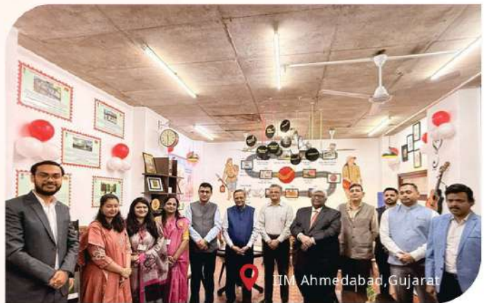
IIM Ahmedabad, Gujarat