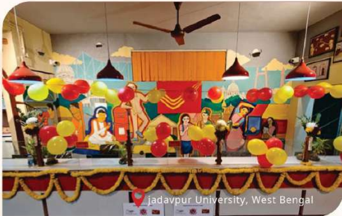
Jadavpur University, West Bengal