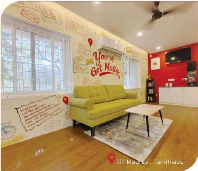
IIT Madras, Tamilnadu