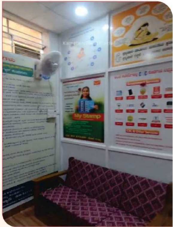
ജോലിസ്ഥലത്ത് സുഖവും അന്തസ്സും പ്രോത്സാഹിപ്പിക്കുന്നതിനുള്ള ഒരു ക്ഷേമ സംരംഭമെന്ന നിലയിൽ ജീവനക്കാരുടെ ക്ഷേമത്തിനായുള്ള വകുപ്പിന്റെ പ്രതിബദ്ധതയെ ഊട്ടിയുറപ്പിച്ചു കൊണ്ട് ബെല്ലാരിയിലെ പോസ്റ്റ് ഓഫീസ് സൂപ്രണ്ട് ഒരു ഫീഡിംഗ് റൂം ഉദ്ഘാടനം ചെയ്തു.