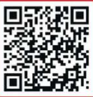
വിഡിയോ കാണാൻ ഈ ക്യാന്റർ കോഡ് സ്കാൻ ചെയ്യുക

ഭാരതത്തിലുടനീളെ ലോജിസ്റ്റിക് ശൃംഖലയുടെ ആധാരവും ഗ്രാമവികസനം കാര്യക്ഷമമാക്കുന്നതിൽ ശക്തമായ ഘടകവുമായി ഭാരതീയ തപാലിന്റെ പങ്ക് ശക്തിപ്പെടുത്തിക്കൊണ്ട് കൃഷി, കർഷകക്ഷേമ വകുപ്പുമായും ഗ്രാമവികസന മന്ത്രാലയവുമായും തപാൽ വകുപ്പ് ഒരു നാഴികക്കല്ലായ ധാരണാപത്രത്തിൽ ഒപ്പുവച്ചു. ബഹുമാനപ്പെട്ട കേന്ദ്ര വാർത്താവിനിമയ, വടക്കുകിഴക്കൻ മേഖല വികസന മന്ത്രി ശ്രീ ജ്യോതിരാദിത്യ എം. സിന്ധ്യയുടെയും കേന്ദ്ര ഗ്രാമവികസന, കൃഷി, കർഷകക്ഷേമ മന്ത്രി ശ്രീ ശിവരാജ് സിംഗ് ചൗഹാന്റെയും സാന്നിധ്യത്തിലാണ് രണ്ട് ധാരണാപത്രങ്ങളും ഒപ്പുവച്ചത്.