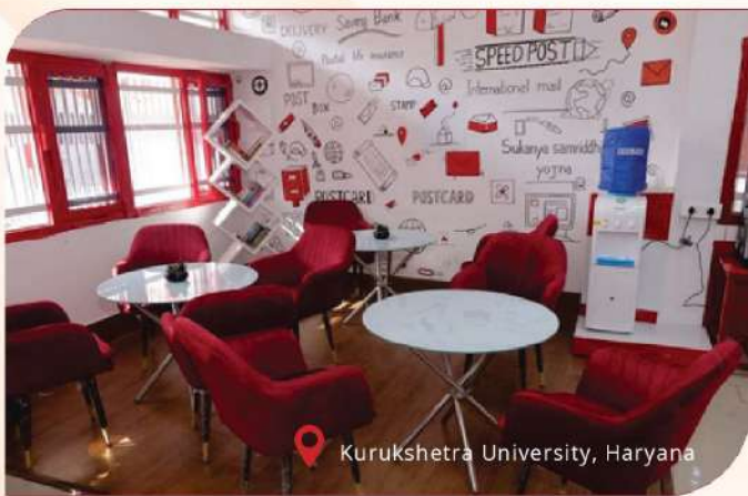
Kurukshetra University, Haryana