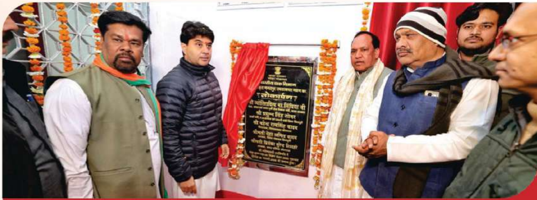
തപാൽ അടിസ്ഥാന സൗകര്യങ്ങളും പൂർ സേവനങ്ങളും ശക്തിപ്പെടുത്തൽ

ഭാരതത്തിന്റെ ബഹുമാന്യനായ പ്രധാനമന്ത്രി ശ്രീ നരേന്ദ്ര മോദി 2026 ജനുവരി 23-ന് കേരളത്തിലെ തിരുവനന്തപുരത്ത് അത്യാധുനിക സൗകര്യങ്ങളോടു കൂടി നിർമ്മിച്ച പൂജപ്പുര ഹെഡ് പോസ്റ്റ് ഓഫീസ് മന്ദിരം ഉദ്ഘാടനം ചെയ്തു. നവീകരിച്ച അടിസ്ഥാന സൗകര്യങ്ങൾ, മെച്ചപ്പെട്ട ഡിജിറ്റൽ കണക്റ്റിവിറ്റി, പൊതുജനങ്ങൾക്ക് വിപുലമായ സേവന വിതരണം എന്നിവയുൾപ്പെടെ പൂർ കേന്ദ്രീകൃത സേവനങ്ങൾക്കായുള്ള ഇന്ത്യാ പോസ്റ്റിന്റെ വീക്ഷണത്തെ ഈ അധുനിക സൗകര്യം പ്രതിഫലിപ്പിക്കുന്നു. തെക്കൻ മേഖലയിലെ തപാൽ സേവനങ്ങൾ ശക്തിപ്പെടുത്തുന്നതിനും സാമ്പത്തിക ഉൾപ്പെടുത്തൽ, ഡിജിറ്റൽ ശാക്തീകരണം, തടസ്സമില്ലാത്ത ലോജിസ്റ്റിക്സ് എന്നീ സർക്കാരിന്റെ മുൻഗണനകളെ പിന്തുണയ്ക്കുന്നതിനുമുള്ള ഇന്ത്യാ പോസ്റ്റിന്റെ പ്രതിബദ്ധതയെ ഉദ്ഘാടനം രേഖപ്പെടുത്തുന്നു.