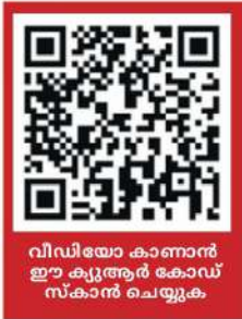
വീഡിയോ കാണാൻ ഈ ക്യാന്റർ കോഡ് സ്കാൻ ചെയ്യുക