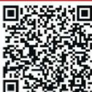
വീഡിയോ കാണാൻ ഈ ക്യൂആർ കോഡ് സ്കാൻ ചെയ്യുക

ഇൻഡോർ പോസ്റ്റൽ മേഖലയ്ക്ക് കീഴിലുള്ള ഖാണ്ഡ്യ ഡിവിഷനിൽ പോസ്റ്റൽ ലൈഫ് ഇൻഷുറൻസിനായുള്ള (പിഎൽഐ) പ്രവർത്തനത്തിനിടെ ഒരു മാർക്കറ്റിംഗ് എക്സിക്യൂട്ടീവ് കേൾവിയും സംസാരവും വൈകല്യമുള്ള ഒരു ഉപഭോക്താവുമായി ഇടപഴകിയപ്പോൾ ഒരു സവിശേഷ സാഹചര്യം ഉടലെടുത്തു. ആശയവിനിമയ തടസ്സങ്ങൾ ഉണ്ടായിരുന്നിട്ടും വെല്ലുവിളി ഉൾക്കൊള്ളുന്ന സേവനത്തിനുള്ള അവസരമായി രൂപാന്തരപ്പെട്ടു. ഖണ്ഡ്യ ഹെഡ് പോസ്റ്റ് ഓഫീസിലെ മാർക്കറ്റിംഗ്