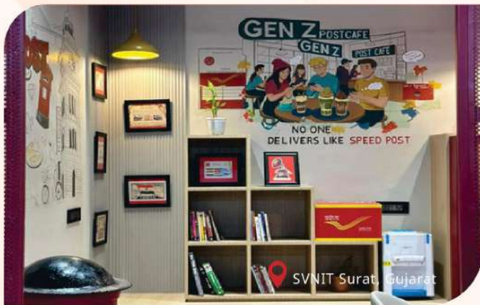
SVNIT Surat, Gujarat