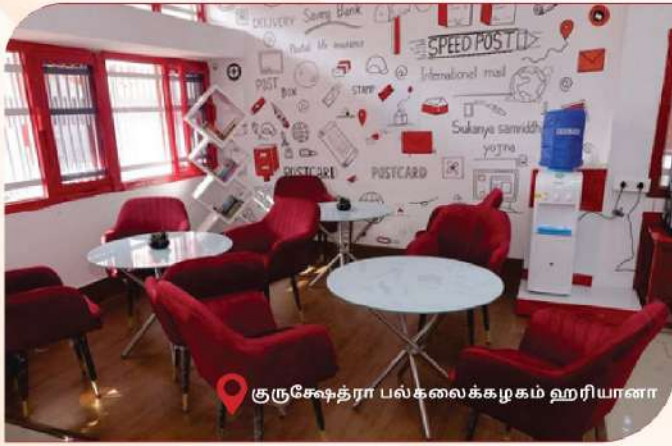
குருசேத்தரர் பல்கலைக்கழகம் ஹரியானா