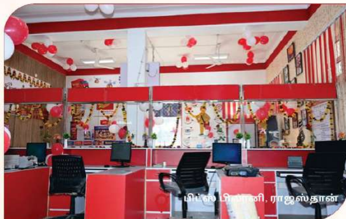
மிப்ஸ் பிளாஸி, ராஜஸ்தான்