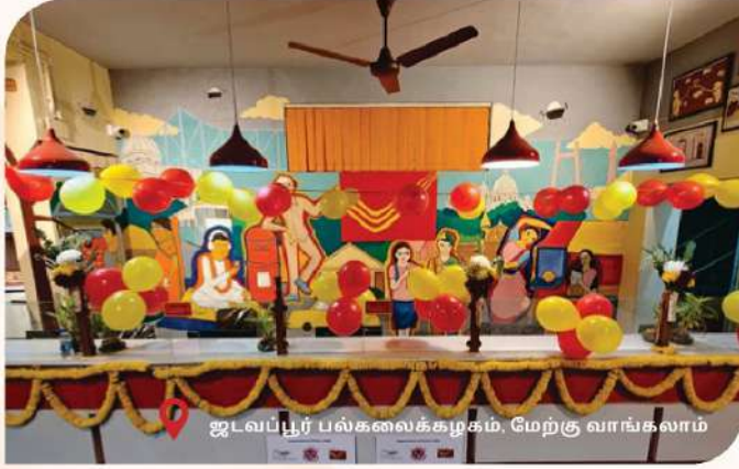
ஜடவப்பூர் பல்கலைக்கழகம், மேற்கு வாங்கலாம்