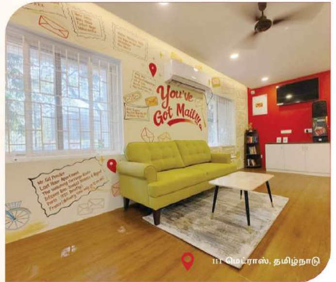
ஐ ஐ மெட்ராஸ், தமிழ்நாடு