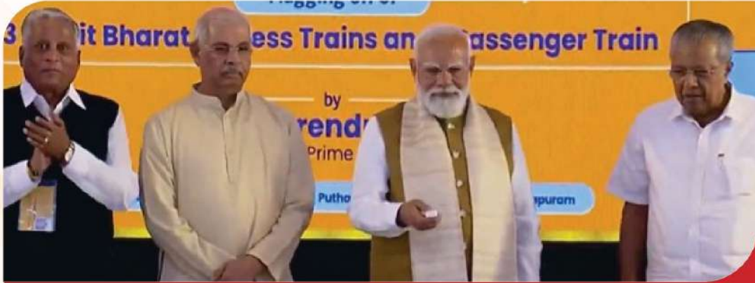
பூஜப்புரா தகைமை அஞ்சல் நிலையத்தை மாண்புமிகு பிரதமர் தொடங்கி வைத்திட்டார்:

2026, ஜனவரி, 23 அன்று, மாண்புமிகு இந்தியப்பிரதமர் நரேந்திர மோடி அவர்கள், கேரள மாநிலம், திருவனந்தபுரத்தில், பூஜப்புரா தலைமை அஞ்சல் நிலையத்தை முற்றிலும் நவீன மயமாக்கப்பட்ட, அப் டு டேட் டான வசதிகளுடன் தொடங்கி வைத்தார். இந்த நவீனமான அஞ்சலக வசதி, தரமுயர்த்தப்பட்ட உள்கட்டமைப்பு வசதிகளுடன், உயர்த்தப்பட்ட எண்ணியல் தொடர்புத்திறனுடன், பொதுமக்களுக்கு விரிவாக்கப்பட்ட சேவை வழங்கலுடன் நிறுவப்பட்டு, குடிமக்களை மையமிட்ட சேவைகளுக்கான இந்திய அஞ்சல் துறையின் தொலைநோக்குப்பார்வையைத் தன்னுள் பொதிந்து வைத்துள்ளது. இந்தத் தொடக்க விழா, நிதியியல் உள்ளாக்கம், எண்ணியல் அதிகார பலமளித் தல், விளிம்புகளற்ற சூழல் துணையமைப்புகள் ஆகியவற்றின் அரசாங்க அளவிலான முன்னுரிமைகளுக்கு ஆதரவளிப்பதையும், தெற்கு மண்டலத்தில் அஞ்சல் சேவைகளை வலிமைப்படுத்திவதில் இந்திய அஞ்சல் துறையின் கடப்பாட்டுறுதியையும் முக்கியத்துவம் வாய்ந்ததாக ஆக்குகிறது.