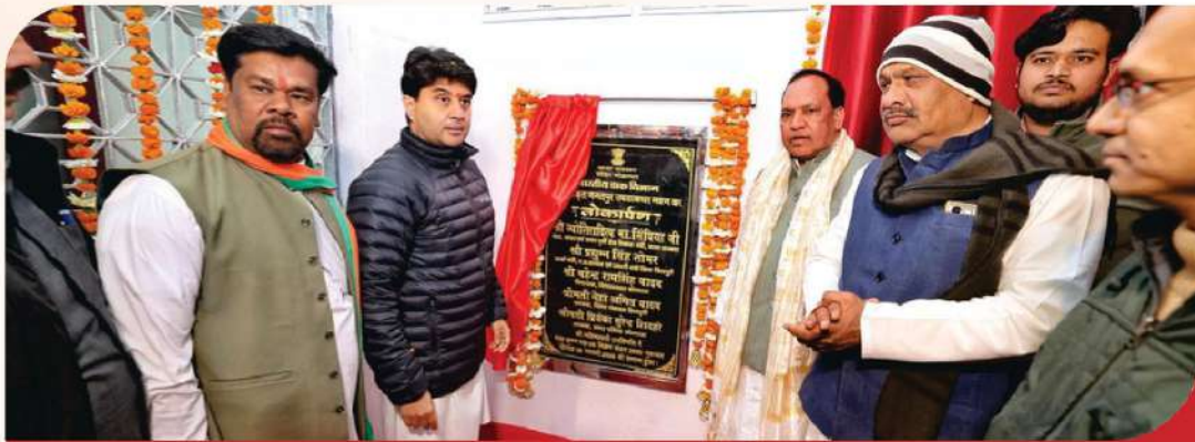
அஞ்சல் உள்கட்டமைப்பு வசதிகளையும், குடிமக்கள் சேவைகளையும் வலிமைப்படுத்துதல்:

2026, ஜனவரி, 23 அன்று, மாண்புமிகு இந்தியப்பிரதமர் நரேந்திர மோடி அவர்கள், கேரள மாநிலம், திருவனந்தபுரத்தில், பூஜப்புரா தலைமை அஞ்சல் நிலையத்தை முற்றிலும் நவீன மயமாக்கப்பட்ட, அப் டு டேட் டான வசதிகளுடன் தொடங்கி வைத்தார். இந்த நவீனமான அஞ்சலக வசதி, தரமுயர்த்தப்பட்ட உள்கட்டமைப்பு வசதிகளுடன், உயர்த்தப்பட்ட எண்ணியல் தொடர்புத்திறனுடன், பொதுமக்களுக்கு விரிவாக்கப்பட்ட சேவை வழங்கலுடன் நிறுவப்பட்டு, குடிமக்களை மையமிட்ட சேவைகளுக்கான இந்திய அஞ்சல் துறையின் தொலைநோக்குப்பார்வையைத் தன்னுள் பொதிந்து வைத்துள்ளது. இந்தத் தொடக்க விழா, நிதியியல் உள்ளாக்கம், எண்ணியல் அதிகார பலமளித் தல், விளிம்புகளற்ற சூழல் துணையமைப்புகள் ஆகியவற்றின் அரசாங்க அளவிலான முன்னுரிமைகளுக்கு ஆதரவளிப்பதையும், தெற்கு மண்டலத்தில் அஞ்சல் சேவைகளை வலிமைப்படுத்திவதில் இந்திய அஞ்சல் துறையின் கடப்பாட்டுறுதியையும் முக்கியத்துவம் வாய்ந்ததாக ஆக்குகிறது.