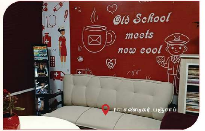
PGI சண்டிகர், பஞ்சாப்