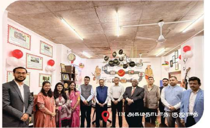
IN அகமதாபாத், குஜராத்