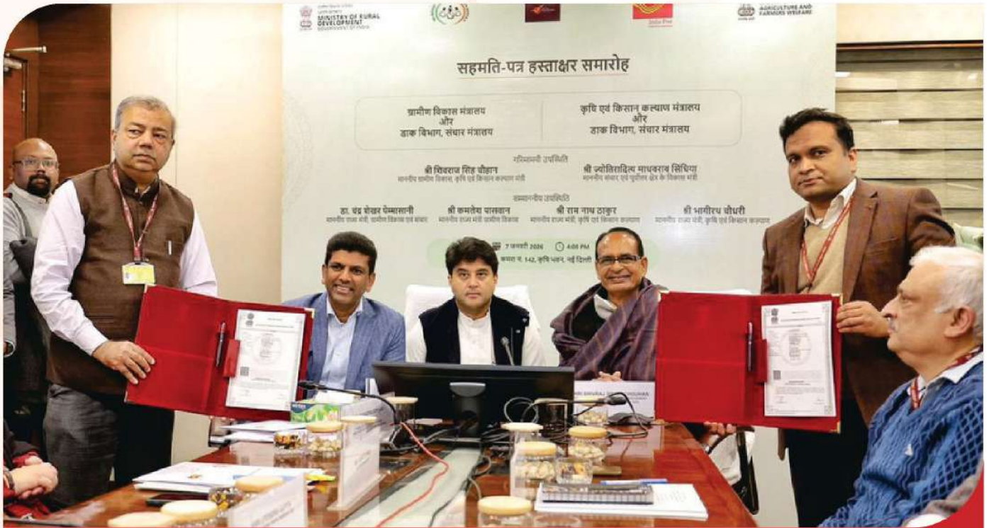
சூழல் துணையமைப்புகள், ஊரகச்சேவைகள் வழங்கல் ஆகியவற்றை வலிமைப்படுத்துவதில் பங்கேற்றல்