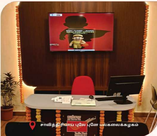
சாவித்திரியா புனே பல்கலைக்கழகம்