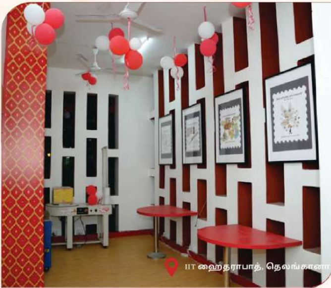
ஐ ஐ ஹைதராபாத், தெலங்காணா

நாடு முழுவதிலுமுள்ள முன்னணிக் கல்விப்புல நிறுவனங்களில் மொத்தம் 45 புதிய தலைமுறை அஞ்சல் நிலையங்கள் தொடங்கி வைக்கப்பட்டுள்ளன. ஹைதராபாத் ஐ ஐ எம், அஹமதாபாத் ஐ ஐ எம், சூரத் எஸ் வி என் ஐ டி, மெட்ராஸ் ஐ ஐ டி, புனே பல்கலைக்கழகம், காஷ்மீர் பல்கலைக்கழகம் போன்றவையும், இவை போன்ற வேறு பல முக்கியக் கல்வி நிலையங்களும் இவற்றில் அடங்கும். இவற்றில், 2026 ஜனவரியில் மட்டும் 11 அஞ்சலகங்கள் தொடங்கப்பட்டுள்ளன. செயலாக்கமுள்ள மாணவர்களின் பங்கேற்புடன் வடிவமைக்கப்பட்டுள்ள இந்தப் புதிய தலைமுறை அஞ்சல் நிலையங்கள், நவீன உள்ளலங்காரங்கள், எண்ணியல் சேவைகள், இலவச வை - ஓபை, மற்றும் புடைப்புருவாக்க வெளிகள் ஆகிய அம்சங்களைக் கொண்டவை. இந்திய அஞ்சல்துறையின் நீண்டகாலப் பாரம்பரியத்துடன், புதிய யுகத்தின் புத்துருவாக்கத்தைக் கலந்த இந்த முயற்சி, இளம் பயனாளர்களுடன் இந்திய அஞ்சல் துறையின் இணைப்பை வலுவாக்கியுள்ளது.