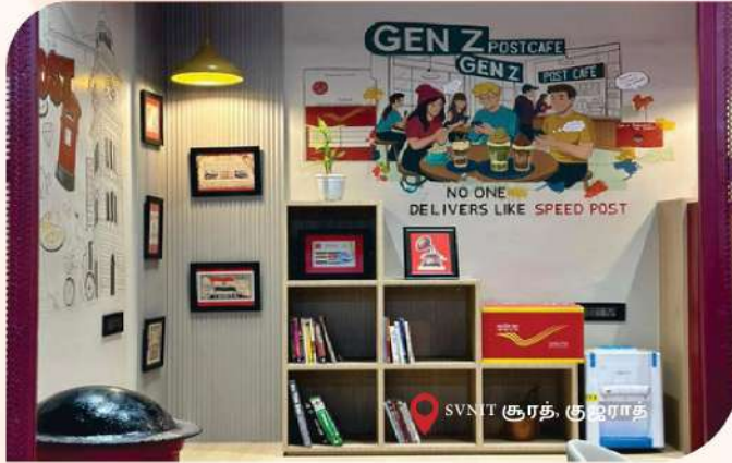
SVNT சூரத், குஜராத்