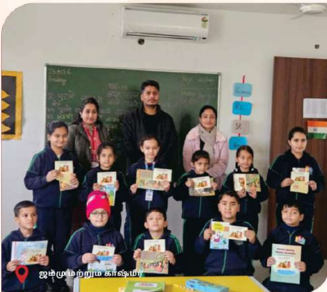
ஜம்மு மற்றும் காஷ்மீர்